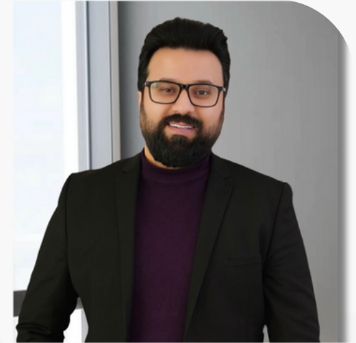
به‌لین واحید محمد دامه‌زینەر و به‌رپوه‌به‌ری جیبه‌جیکار Take Production

هه‌روه‌ها پینشینه‌ی نیوده‌وله‌تی هه‌یه که بریتیه له به‌ره‌مه‌ئینانی فیلمی دیکۆمینتاری بو گروپی ENX و به‌ره‌مه‌ئینانی راپورتی تایبته بو که‌ناله جیاوازه‌کان.